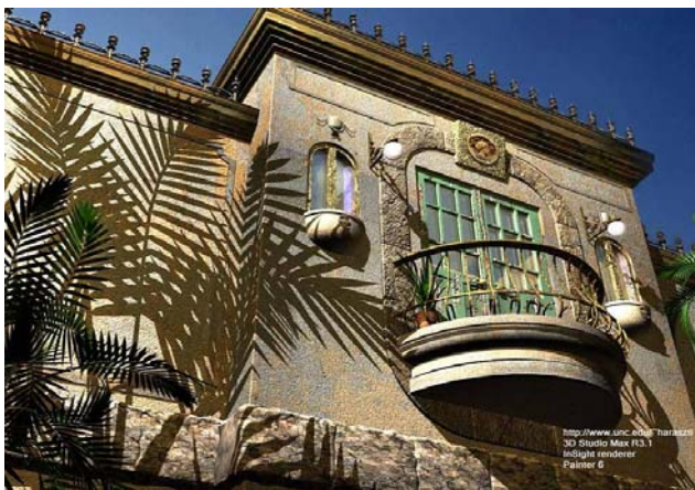
Рис. 1. Реалистичные изображения, полученные нашим модулем моделирования освещенности в среде 3DS Max.

На рис. 1 представлены результаты моделирования освещенности и синтеза реалистичных изображений для моделей, созданных в среде 3DS Max. Высокий реализм достигается благодаря высокой степени детализации геометрической модели, подготовленной дизайнерами в CAD системе, и физически аккуратному моделированию распространения света, поддерживаемому нашим модулем.