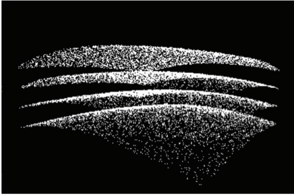
Рис. 2: Пример входных данных для алгоритма сегментации.

Рассматриваемый в [1] класс задач предполагает, что поверхности оказываются похожими на эллиптический параболоид; кроме того поверхности имеют небольшую выпуклость. Пример входных данных показан на рис. 2.