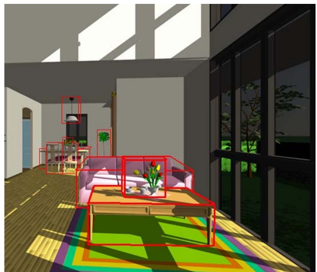
Рис. 2. Организация сцены для двухуровневой трассировки лучей. Красными контурами показаны параллелепипеды, ограничивающие объекты сцены.

Организация сцены для двухуровневой трассировки проиллюстрирована на рис. 2.