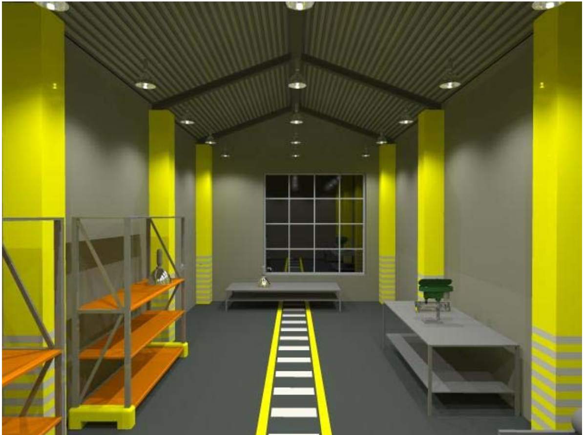
Рис. 4б. Сцена Montage