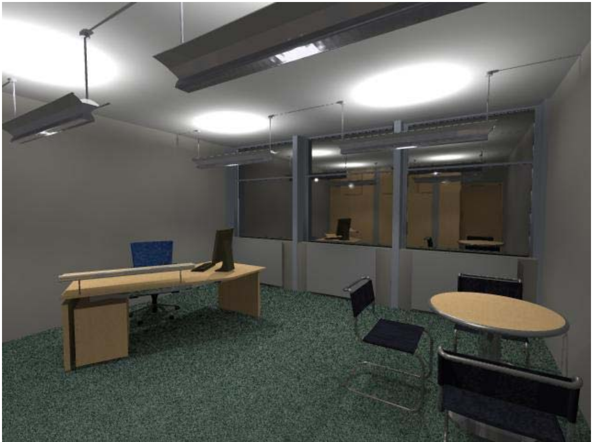
Рис. 4а. Сцена Office