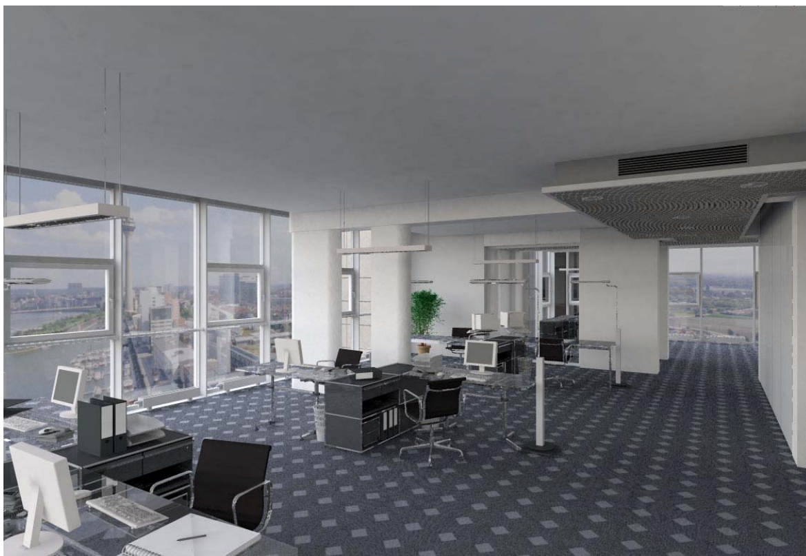
Рис. 2а. Пример фиксированной сцены