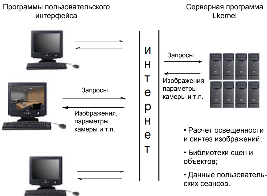
Рис. 1. Организация Интернет-приложения для интерактивного физически аккуратного моделирования освещенности; взаимодействие компонентов пользовательского интерфейса с серверным компонентом

Дополнительным аргументом в пользу такого решения является необходимость защиты данных, представляющих сцены. Для получения высококачественных изображений необходимы сцены с высокой степенью детализации геометрии, тщательно подобранными (или даже измеренными) свойствами поверхностей и источников света. Создание таких сцен может занимать недели работы высококвалифицированного персонала, и обычно они являются объектом собственности, не подлежащим свободному распространению. С этой точки зрения важно, чтобы детальное описание сцен не передавались за пределы предоставляющего их сайта.