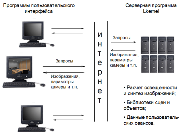
Рис. 1. Организация Интернет-приложения для интерактивного физически аккуратного моделирования освещенности; взаимодействие компонентов пользовательского интерфейса с серверным компонентом

действий редактирования, текущие параметры камеры и т.п. Серверный компонент поддерживает одновременную работу нескольких пользователей и обеспечивает размещение данных, ассоциированных с множеством текущих сеансов.