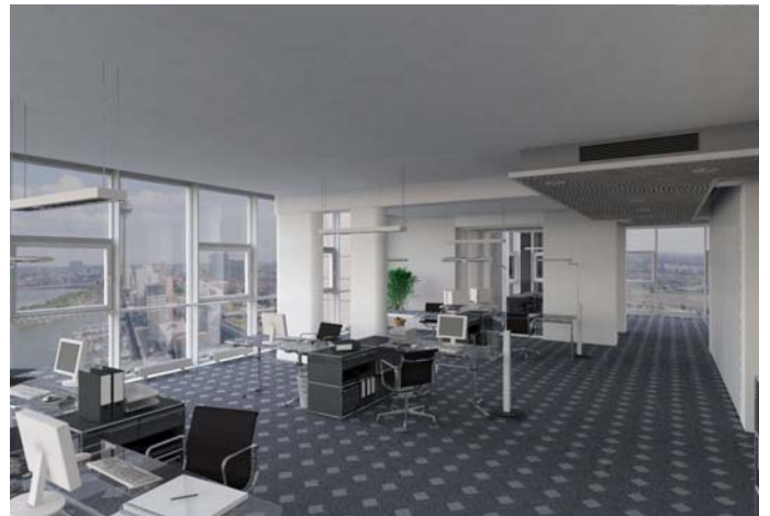
Рис. 2а. Пример фиксированной сцены

представлен на рис. 2а. Параметрическая сцена представляет собой помещение, имеющее форму призмы: пол и потолок имеют форму многоугольника, а стены - прямоугольные, одинаковой высоты. Пример параметрической сцены представлен на рис. 2б. В каждый момент может быть загружена только одна сцена, и при загрузке новой сцены теряется возможность работать с предыдущей. Данные сцены загружаются в вычислительный кластер сайта, предоставляющего Интернет-приложение. На компьютер пользователя пересылаются только ее изображения в соответствии с действиями, которые он производит.