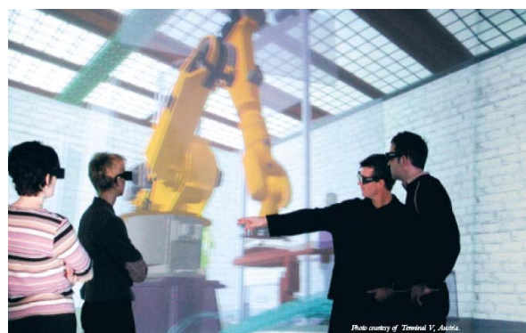
Рис. 3. Проведение стерео презентации в зале Terminal V

Таким образом, система предназначена для показа протяженных панорамных стереокадров, где каждый результирующий стереокадр состоит из трех частей (левый, правый и фронтальный экран соответственно) и управляемого оператором с помощью компьютера с обычным монитором (рис. 3).