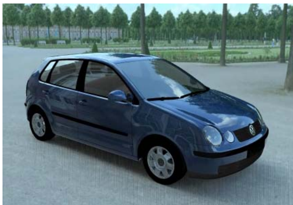
Рис. 4. Стереоизображение компьютерной модели автомобиля

Система была успешно опробована на оборудовании комплекса Terminal V. На рис. 4 приведено стереоизображение компьютерной модели автомобиля (показано изображение только левого канала), «встроенной» в реальный природный ландшафт. В качестве источника освещения используется изображение сцены с большим динамическим диапазоном [10].