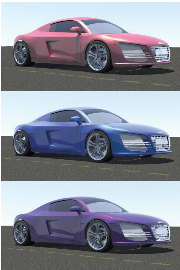
Рис3. Примеры визуализации в Inspire CATIA.

На рис.3. приведены результаты визуализации автомобиля в Inspire CATIA при естественном освещении и использовании различных красок, задаваемых двунаправленной функцией отражения: