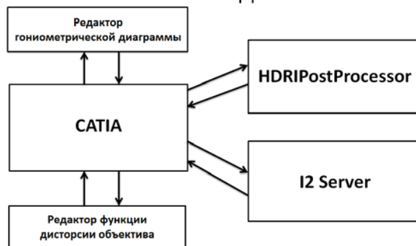
Рис. 1. Основные компоненты системы Inspirer CATIA.

Пользовательский интерфейс системы CATIA написан с использованием библиотеки MFC, в то время как пользовательский интерфейс остальных компонент использует QT SDK. Совместное использование этих двух библиотек в одном выполняемом модуле невозможно, поэтому каждая из компонент на рис. 1 выполнена в виде отдельного выполняемого модуля.