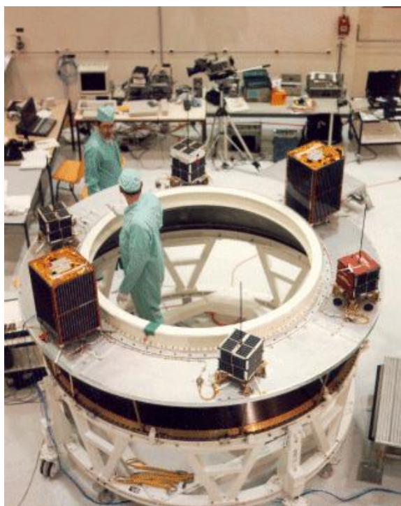
Рис.1. Платформа ASAP для попутного вывода микроспутников

например, здесь , а иной возможный способ попутного вывода на ракете Ariane-5 и хронологию попутного вывода на этих носителях здесь .