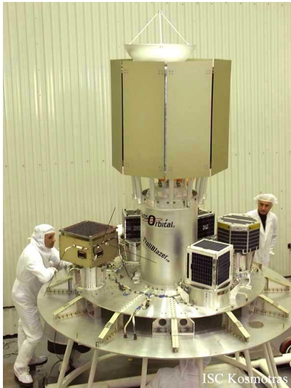
Рис.3. Размещение микроспутников на адаптере ракеты-носителя Днепр

Однако особых иллюзий о возможности решения таким образом задачи дешевого запуска малых спутников питать не следует. Конверсионные ракеты требуют немалых затрат для модернизации и адаптации к новым для них задачам. Да и «акулы рынка» запусков не допустят их широкого «демпингующего» использования. Все так, конечно, но... лед тронулся. Появилось другое понимание того, как можно решать задачи в космосе с меньшими временными и материальными затратами.