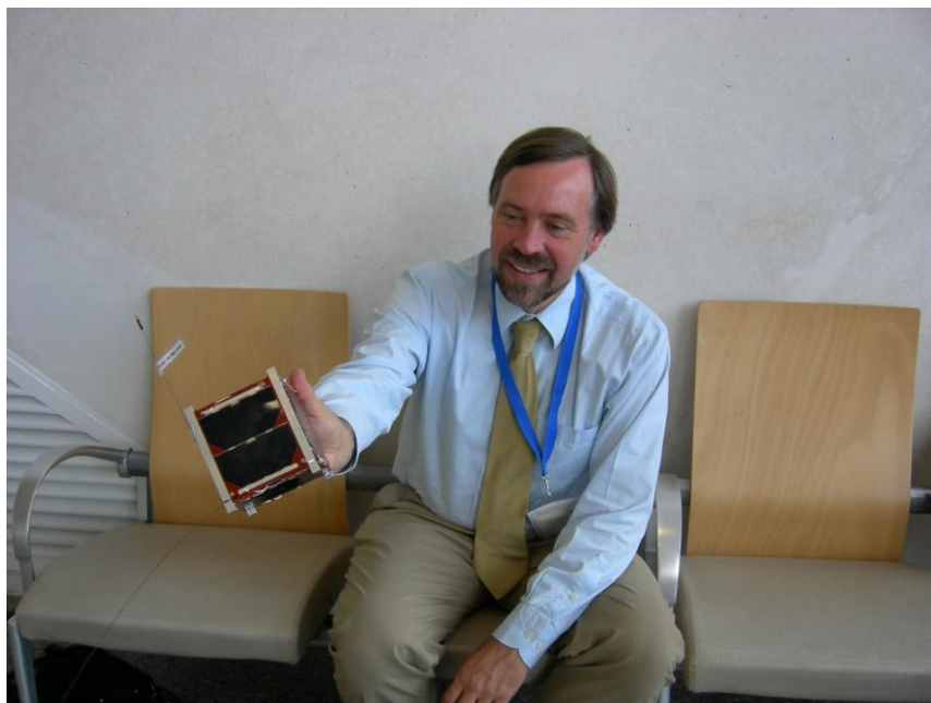
Рис.5. CubeSat (UWE-1) в руках профессора Клауса Шиллинга из Университета Вюрцбурга

CubeSat. Объявленная цена такой услуги — 50 тысяч долларов. Нельзя сказать, что выстроилась очередь из желающих, но то, что мода пошла на CubeSat'ы, сказать можно точно. На рис.5 изображен макет спутника в руках профессора Клауса Шиллинга из Университета Вюрцбурга (Wuerzburg University), Германия, под руководством которого по идеологии CubeSat'a был разработан студентами и успешно выведен на орбиту 27 октября 2005 года спутник UWE-1 . Всего к настоящему времени изготовлено более 35 спутников этой серии и большинство из них выведено на орбиту.