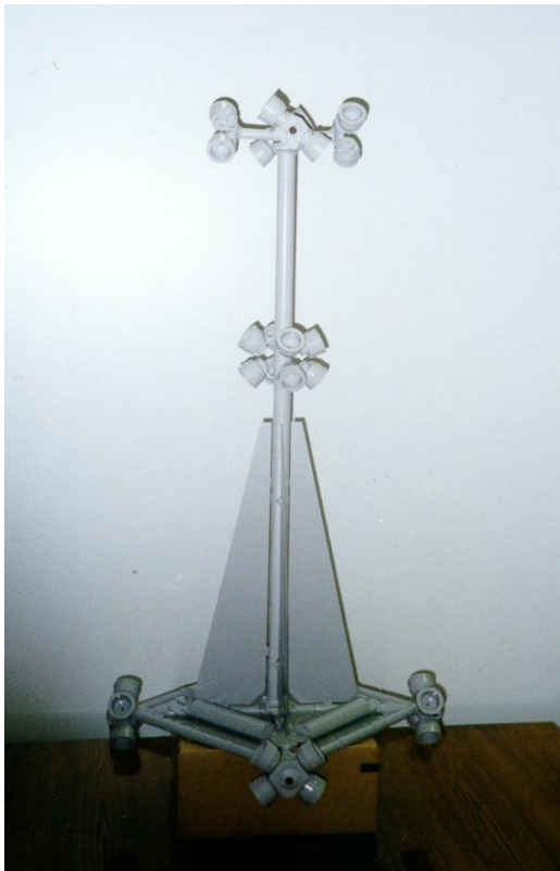
Рис.6. Наноспутник REFLECTOR (НИИ ПП) для проведения уникальных экспериментов с помощью лазерных наземных телескопов