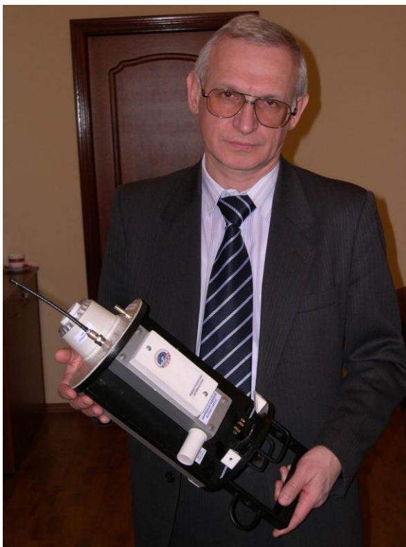
Рис.7. Макет первого российского наноспутника ТНС-0 в руках автора статьи