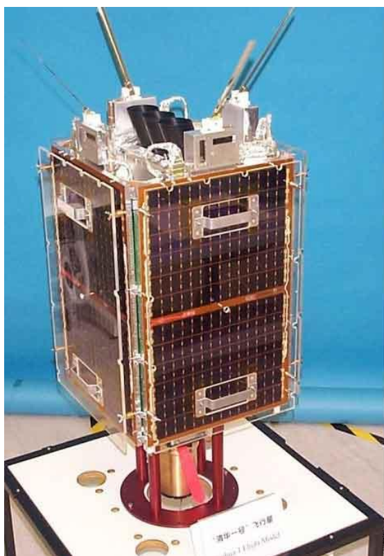
Рис.4. Микроспутник Tsinghua-1 базе типовой платформы SSTL