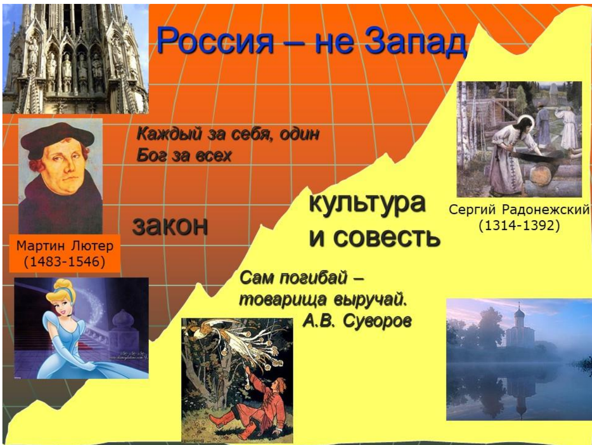
Рис. 1. Сравнение смыслов и ценностей России и Запада

Судя по всему, следующий этап мирового развития будет связан с конфликтом (сценарий С. Хантингтона) или диалогом (сценарий Н.Н. Моисеева) цивилизаций. Следует подчеркнуть, что мир России не является Европой или Западом (см. рис. 1). Это показывают, например, сказки, отражающие характер народа. Любимой в Европе является история о Золушке, – послушной, добродетельной девушке, действовавшей строго в соответствии с данными ей указаниями и получившей в результате прекрасного принца. В России же, напротив, любимый герой – Иван-дурак. Он очень проигрывает на фоне деловитых, хозяйственных братьев, но в экстремальных условиях именно его смелость, доброта, находчивость и позволяет добиться успеха. Отчасти это объясняется тем, что большая часть нашей страны находится, в отличие от Западной Европы, в зоне рискованного земледелия. Если в первом случае систематическая работа дает результат и очень много зависит от усилий одного человека, то во втором – иногда «один день год кормит», а иногда все труды идут прахом, да и чтобы выжить нужны коллективные усилия.