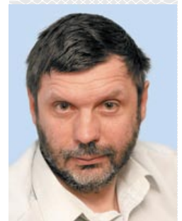
Георгий Геннадьевич МАЛИНЕЦКИЙ