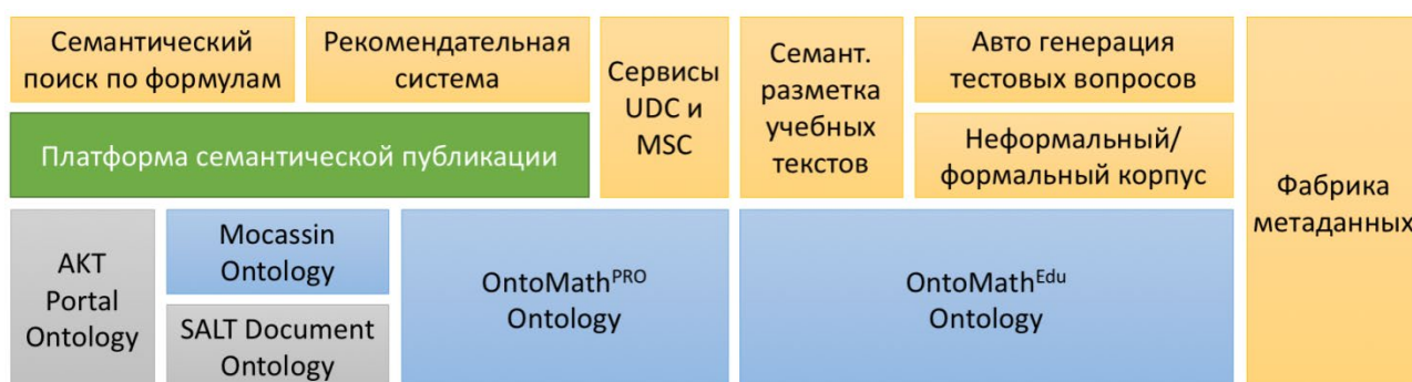
Рис. 1. Архитектура цифровой экосистемы OntoMath. Синим цветом обозначены онтологии, разработанные в рамках проекта OntoMath; серым цветом – внешние онтологии; зеленым цветом – платформа семантической публикации, коричневым – сервисы экосистемы. Компоненты, по уровню расположенные выше, базируются на нижестоящих

Цифровая экосистема OntoMath является технологической платформой цифровой математической библиотеки Lobachevskii-DML, осуществляет взаимодействие набора математических онтологий, инструментов текстовой аналитики, поисковых сервисов и приложений и предназначена для управления математическими знаниями. На рис. 1 представлена современная архитектура цифровой экосистемы OntoMath.