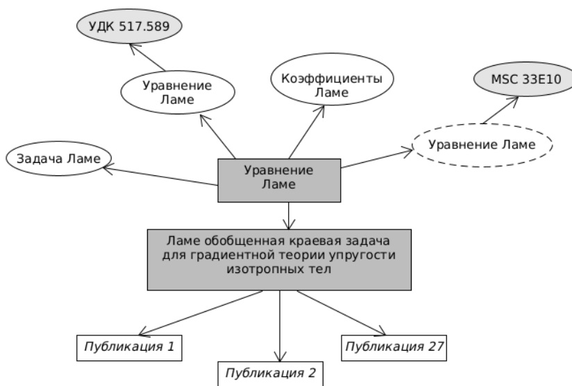
Рисунок 2. Понятие "Уравнение Ламе" и его связи в семантической библиотеке

В качестве примера приведем небольшую часть тезауруса посвященную задаче Ламе [24, 25, 26]. Это статья лексико-семантического указателя для предметной области «механика сплошной среды», раздела композиционные материалы соответствующая понятию «Ламе обобщенная краевая задача для градиентной теории упругости изотропных тел».