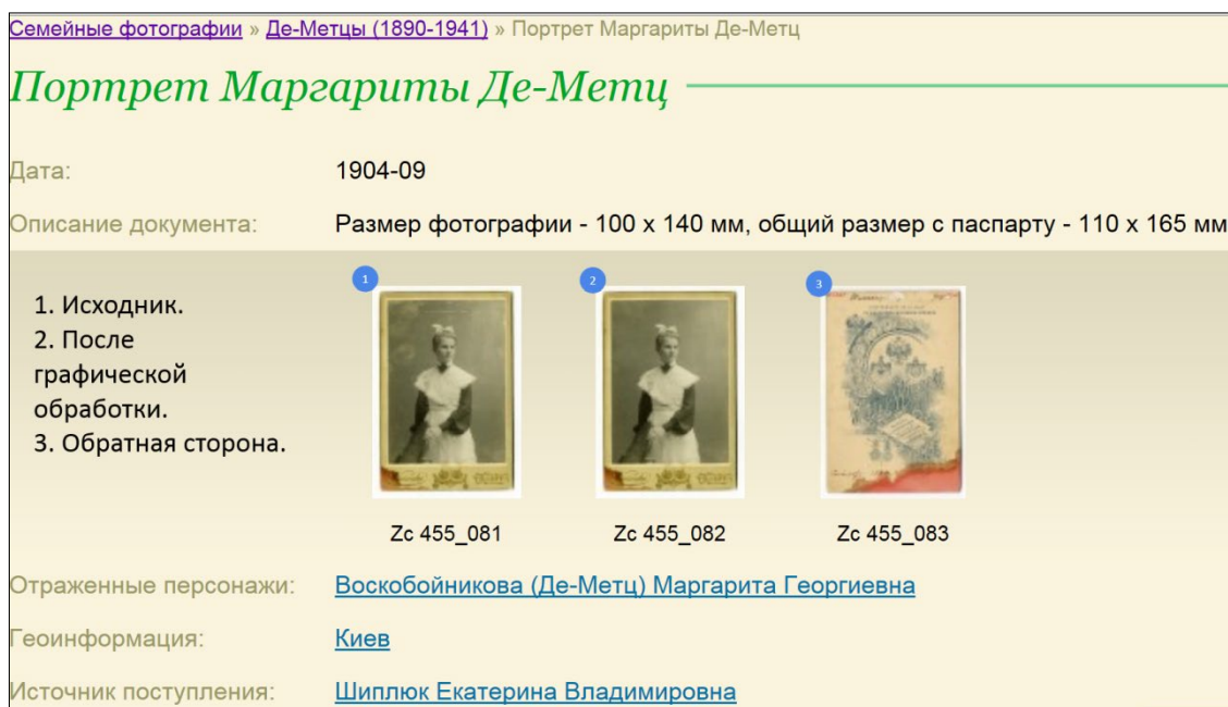
Рис. 3. Визуализация фотодокументов в Открытом архиве СО РАН.