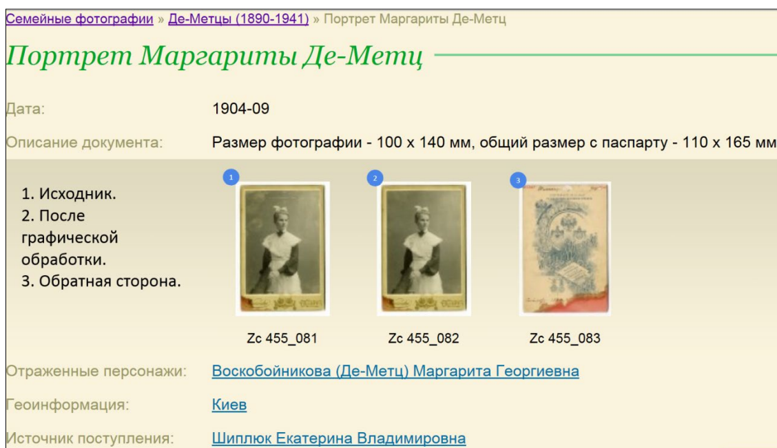
Рис. 3. Визуализация фотодокументов в Открытом архиве СО РАН.

Очевидно, уже нет необходимости доказывать нужность и полезность открытых архивных источников, особенно в условиях значительного ограничения социальной мобильности. И чем полнее будут архивные ИС, тем более продуктивной станет исследовательская работа. В том случае, когда ИС заполняется достаточно репрезентативными и разнообразными источниками, она должна быть снабжена прецизионным поисковым инструментарием, а сами источники, помимо этого, должны быть систематизированы. Открытые архивы СО РАН в данный момент имеют несколько уровней систематизации: фонд, коллекции фонда, подколлекции коллекций (или группы и подгруппы, как в архиве А.П. Ершова). Поисковая же система довольно проста: поиск осуществляется по одному из параметров: по типу документа, по имени персоны, по названию организации, по ключевому слову. Поиск по типу документа не дает прецизионного результата, поскольку к одному типу документов могут относиться артефакты разных фондообразователей. Инструментарий архива академика А.П. Ершова позволяет ограничивать поиск хронологическими рамками, именем персоны, типом документа, то, что и требуется в идеале [Рис. 2]. Задача интеграции нескольких архивных ресурсов на одной платформе должна учитывать это обстоятельство, иначе массив станет слабо изучаемым. Чем больше поисковых возможностей будет у исследователя, тем эффективней он сможет использовать возможности открытых архивов.