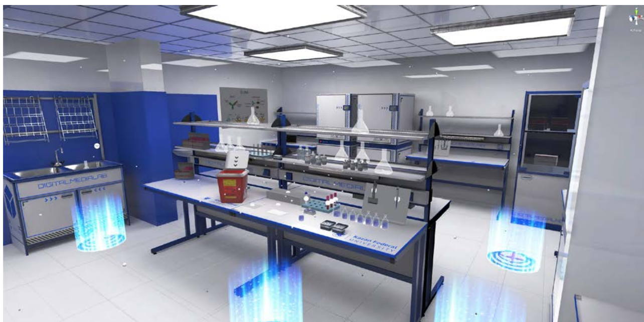
Рис. 1. Биотехнологическая лаборатория в виртуальной реальности – с элементами геймификации и звуковым окружением

Сейчас вряд ли найдётся область, где ещё нет примеров использования разнообразных тренажерных систем с использованием виртуальной реальности, предназначенных для обучения навыкам управления и изучения как гражданской, так и военной техники, проведения малоинвазивных лапароскопических 1 или инвазивных хирургических операций, для отработки практических навыков врачом инструментами у стоматологов, тренажеры по тренировке бригады скорой помощи, для управления разнообразными технологическими процессами, включая совместную работу в коллективе [3], например, обучение экипажей судов рыбопромыслового флота, тушение пожаров [4], обслуживание железнодорожных станций. Например, многопользовательский VR-тренажер экипажей субмарин [5] создан для отработки действий во внештатных ситуациях без подвергания риску жизни экипажа. В мире существует более 600 компаний, имеющих отношение к разработке и производству тренажерных систем.